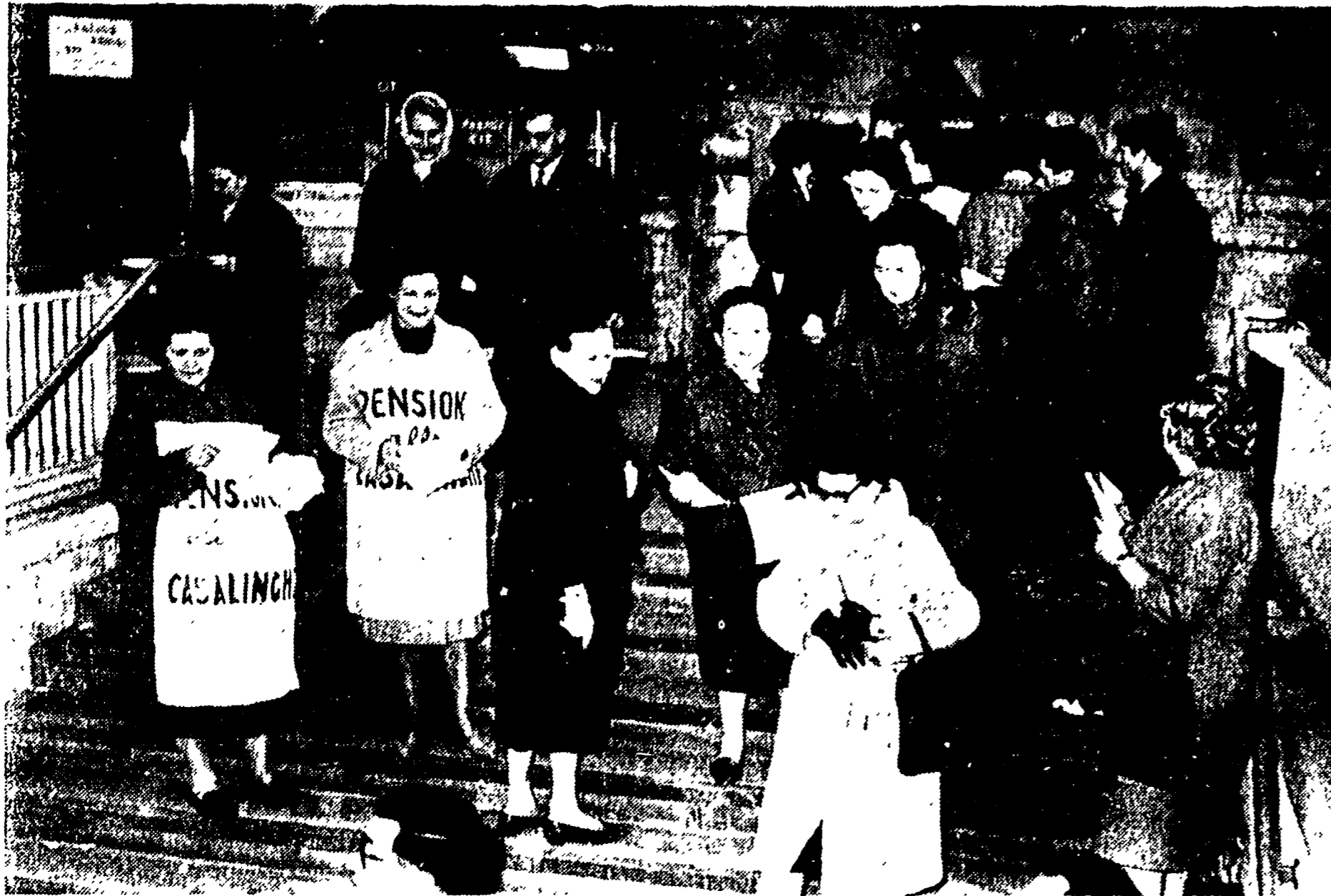
In occasione dell'inizio della discussione, in sede di commissione, dei progetti di legge sulla pensione alle casalinghe anche ieri gruppi di donne romane hanno distribuito volantini nei pressi di Montecitorio

La Commissione lavoro assistenza e previdenza ha iniziato l'esame dei vari progetti di legge - Prima tappa verso una fondamentale conquista del movimento femminile